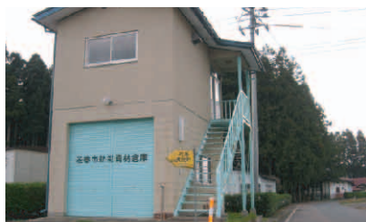
花巻市防災資材倉庫

防災危機管理室は、2009年4月より総務部の中に防災危機管理を統括して担う部門として発足した。災害予防と災害対策の双方から市の防災力を高めていこうとするものである。