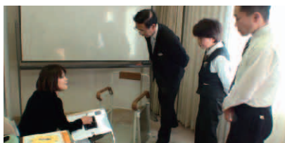
ラップポンの講習の様子

サービスの一環として、聴覚障がいをお持ちの方に筆談用具や専用の目覚まし時計を貸し出したり、客室の浴槽の段差を解消するためのマットを用意するなどの配慮があります。またロビーには多目的トイレやAEDも設置されています。「近年は盲導犬をお連れ