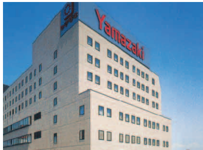
山崎製パン企業年金基金会館