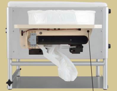
内蔵されている自動ラップ機構

ラップボンが搭載している自動ラップ機構は水を使わず、熱圧着によって排泄物を1回毎に自動で密封します。毎回、個包装にして切り離すので、清潔にご使用いただけます。また、排泄物は個包装になっているので、後処理の手間もなく、お手入れも簡単です。ブラックタンクを使いません。