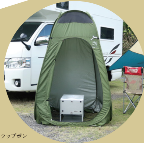
テント内に設置のラップボン