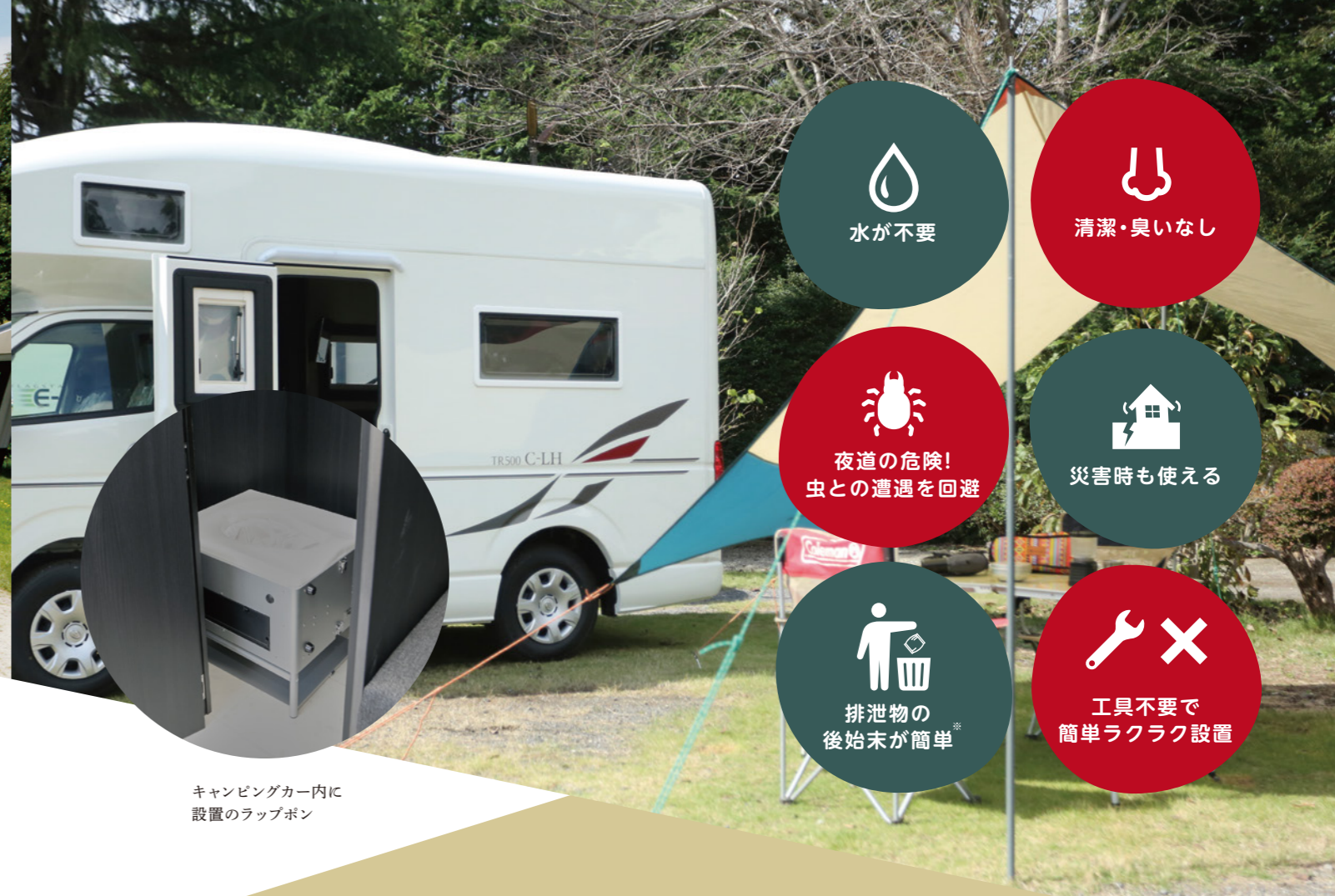
キャンピングカー内に 設置のラップボン